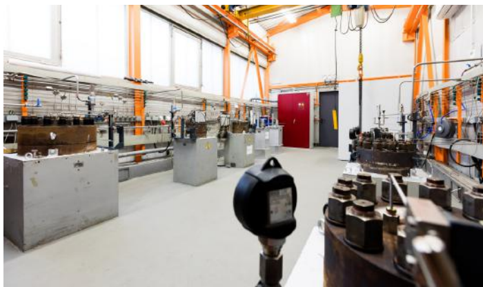
Versuchsaufbau für CO 2 -Korrosionsversuche (rotierender Käfig) und Autoklaven-Labor bei der Salzgitter Mannesmann Forschung GmbH

In Korrosionsversuchen konnten die Mannesmann CO2ready®-Rohre hinsichtlich Sicherheit und Zuverlässigkeit auf ganzer Linie überzeugen. Selbst ein kurzzeitiges Auftreten von freiem Wasser ist kein Problem, solange der Gehalt von säureproduzierendem Stickstoffdioxid und Schwefeldioxid oder von wasserstoffinduzierte Korrosionsmechanismen auslösender Schwefelwasserstoff nur in Spuren im Gas enthalten ist.